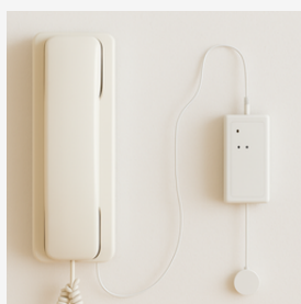
Courant continu de 3 à 24 Volts