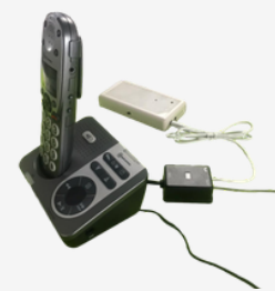
Prise pour téléphone fixe RJ11