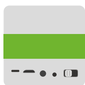
Sonnette et bouton d'appel