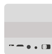
Alertes de présence